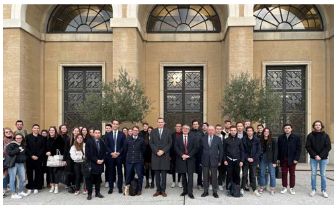
INSTITUT PORTALIS Rentrée des étudiants