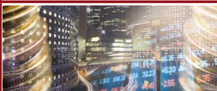
Mention Économie du droit