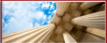
Mention Droit public