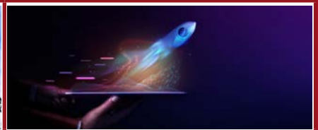
Mention Droit du numérique