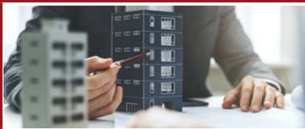
Mention Droit de l'immobilier