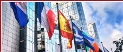
Mention Droit international et droit européen