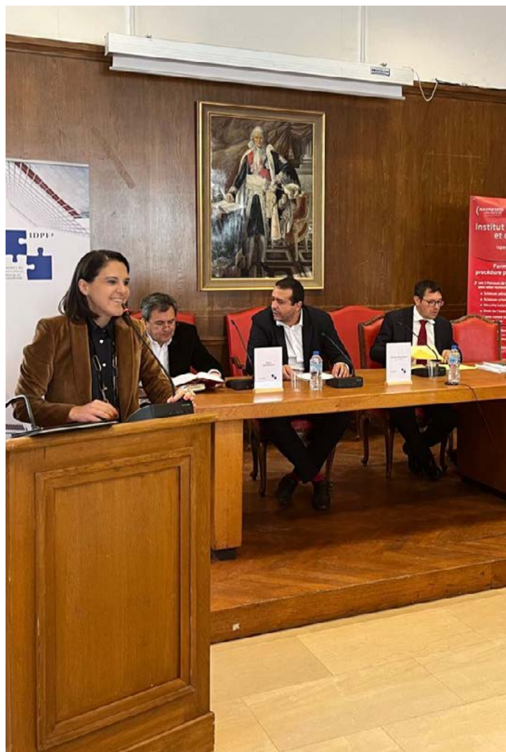
INSTITUT DES SCIENCES PÉNALES ET DE CRIMINOLOGIE – ISPEC Congrès annuel de l'ISPEC