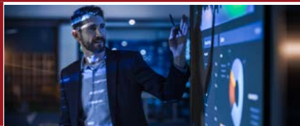
Mention Droit des affaires