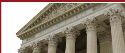
Mention Histoire du droit et des institutions