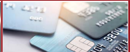
Mention Droit bancaire et financier