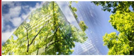
Mention Droit de l'environnement