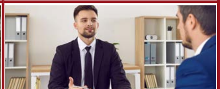
Mention Justice, procès et procédures