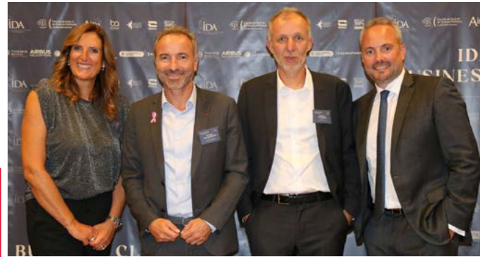
INSTITUT DROIT DES AFFAIRES - IDA IDA business club 2023