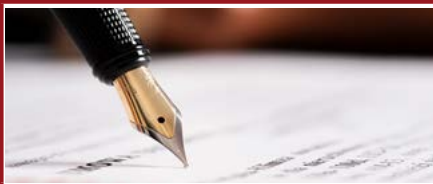
Mention Droit notarial