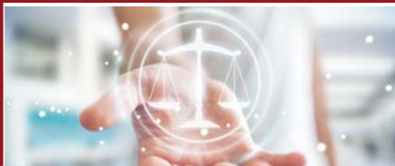
Mention Droit privé