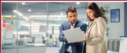
Mention Administration et liquidation d'entreprises en difficulté