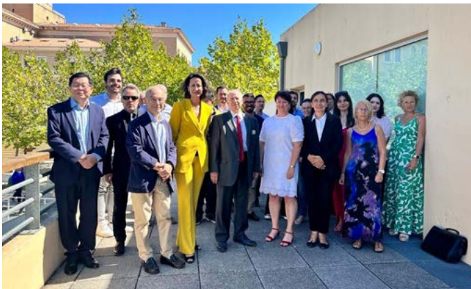
CENTRE D'ETUDES FISCALES ET FINANCIÈRES - CEFF Rentrée du centre