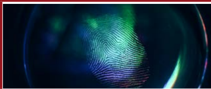
Mention Droit pénal et sciences criminelles