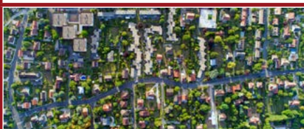
Mention Urbanisme et aménagement