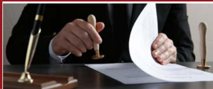
Mention Droit de la santé