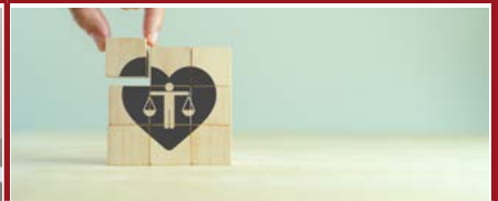
Mention Droit social