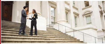
Mention Droit enseignement à distance