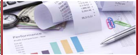
Mention Droit fiscal